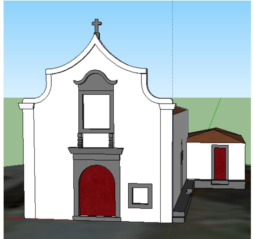
Capela de Santo Amaro