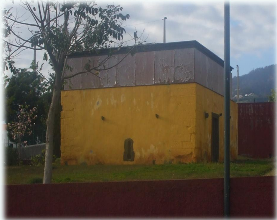
Torre do Capitão