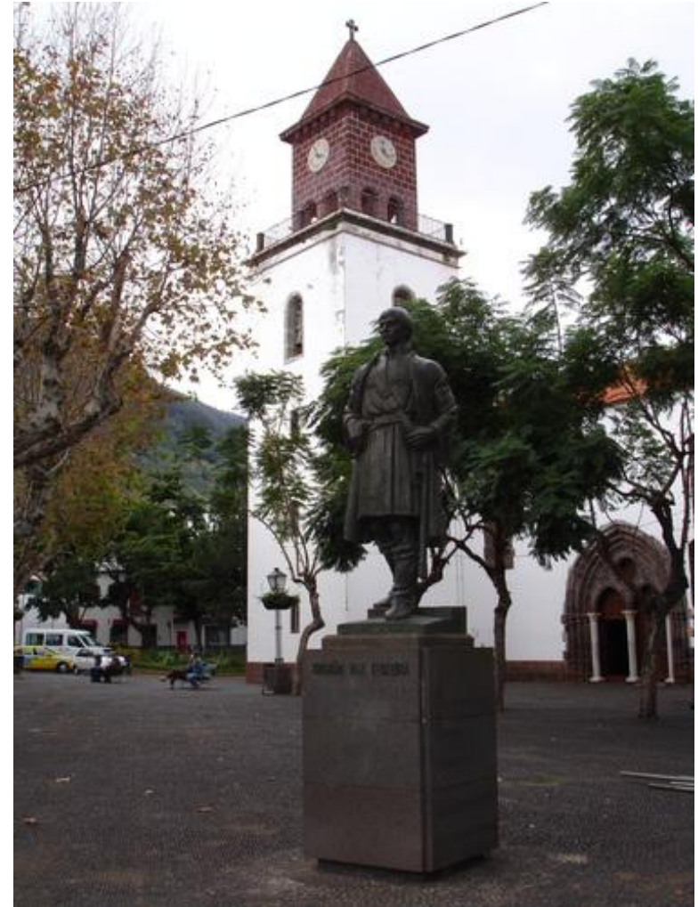
Tristão Vaz Teixeira, em Machico