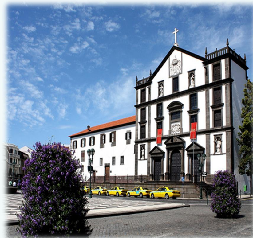
Igreja de São João Evangelista