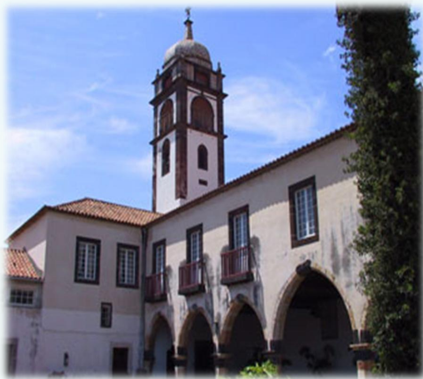
Igreja e Mosteiro de Santa Clara