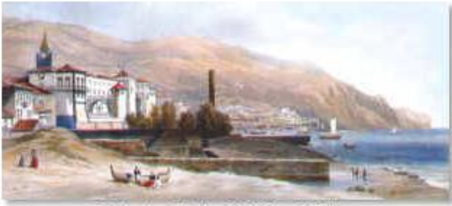
Praia da Cidade 1850, Frank Dillon