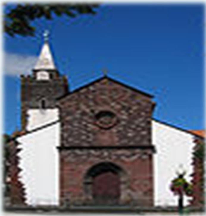
Igreja da Sé