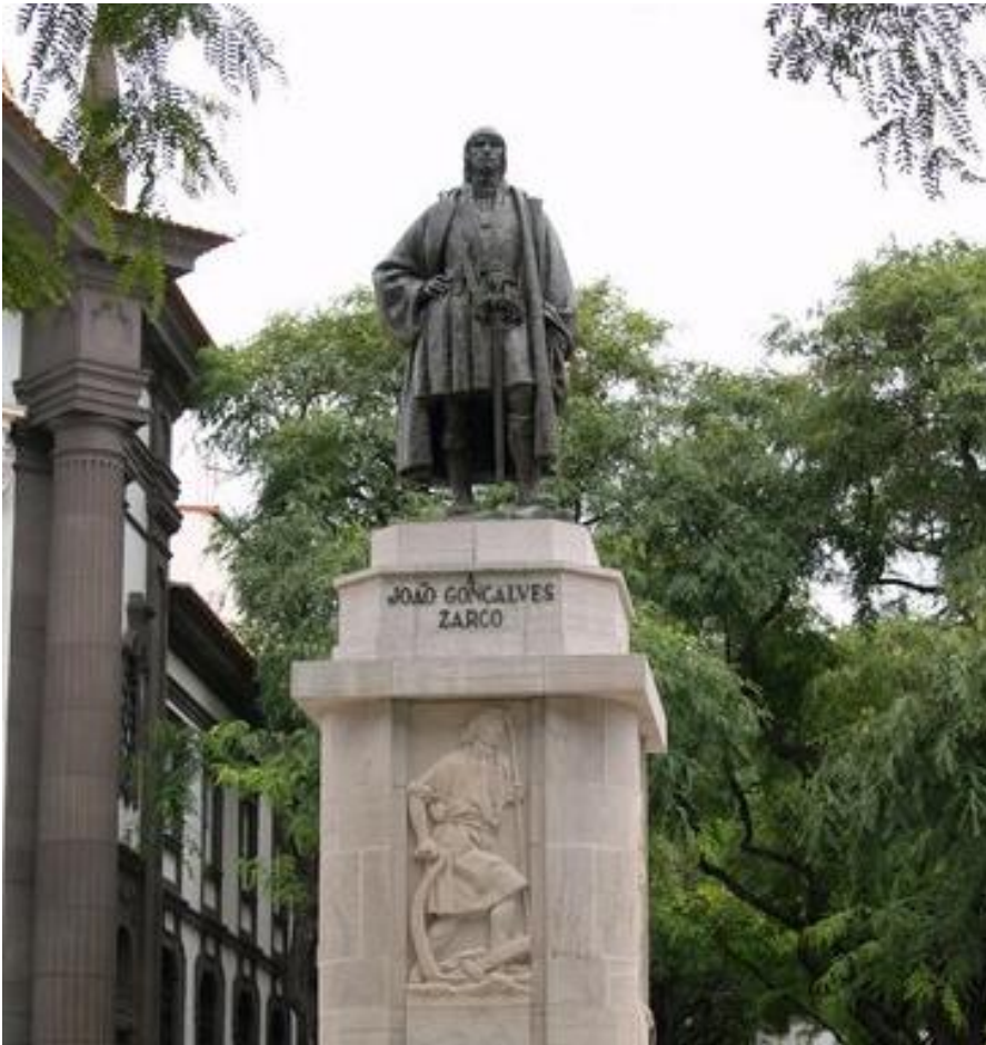
João Gonçalves Zarco, no Funchal